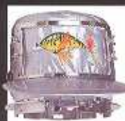
Semi-Wide Cap Frames