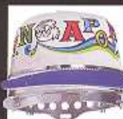
Wide Cap Frames