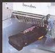
Sleeve Frame (non disponible sur BEDT-ZN-101)