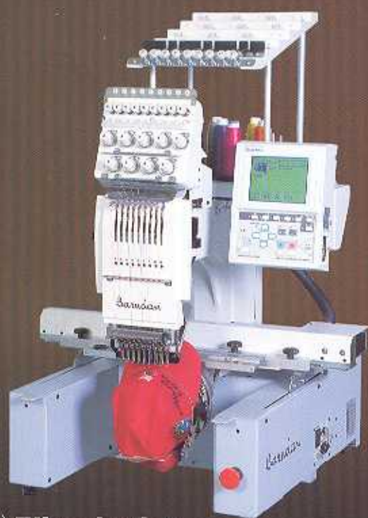
(1) Elite Junior BEDT-ZN-101 avec l'option cap frame

Des machines professionnelles faciles d'utilisation. Une de ces machines répondra à vos exigences.